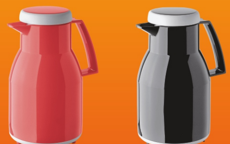
konvice Helios Wash 486 Kč *