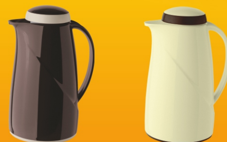
konvice Helios Wave 513 Kč *